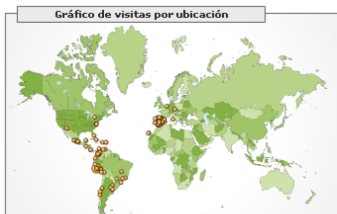
Figura 1. Distribución geográfica de los visitantes de revistaesalud.com

Mucho de lo comentado lo podemos observar mediante el uso de las herramientas de Google Analytics 2 y Google Trends 3 , mediante las que podemos observar la distribución geográfica de nuestros lectores o la evolución que ha tenido la búsqueda del tópico esalud , en relación con el de telemedicina , en los últimos dos años, así como telemedicine y ehealth .